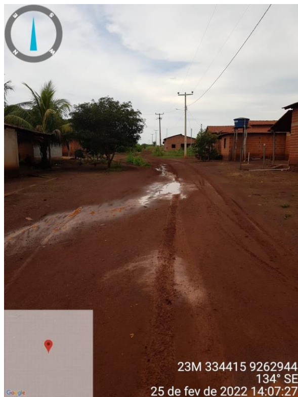
RUA DA CAIXA D'ÁGUA