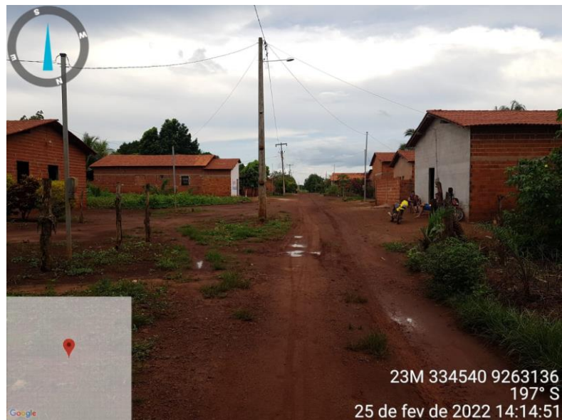
RUA RAIMUNDO COUTINHO

OBRA: PAVIMENTAÇÃO EM BLOCO INTERTRAVADO NO MUNICÍPIO DE SÍTIO NOVO - MA LOCAL: POVOADO BOM LEMBRANÇA