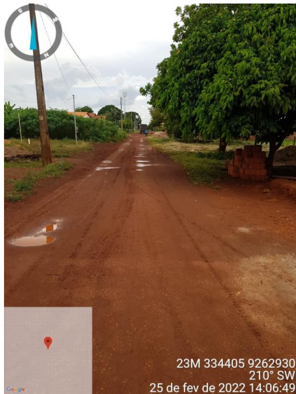
RUA RAIMUNDO FONSECA

OBRA: PAVIMENTAÇÃO EM BLOCO INTERTRAVADO NO MUNICÍPIO DE SÍTIO NOVO - MA LOCAL: POVOADO BOM LEMBRANÇA