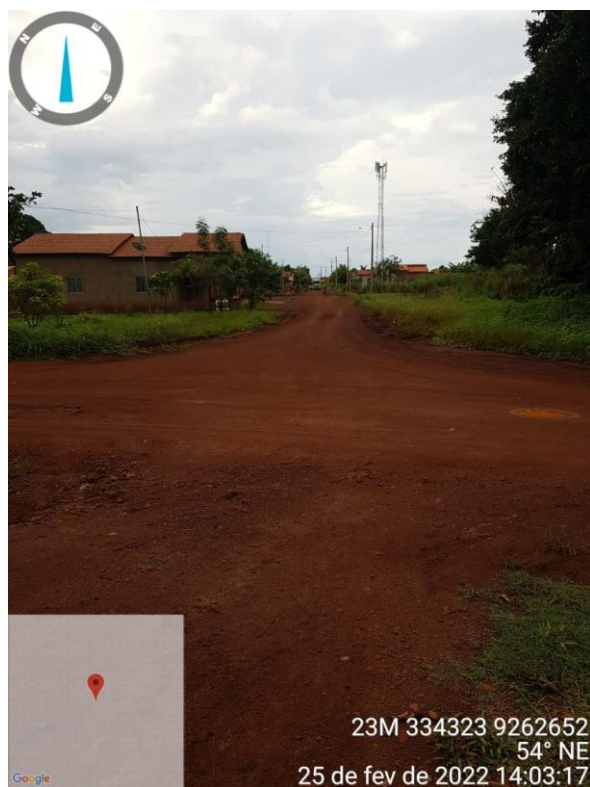
RUA RAIMUNDO FONSECA