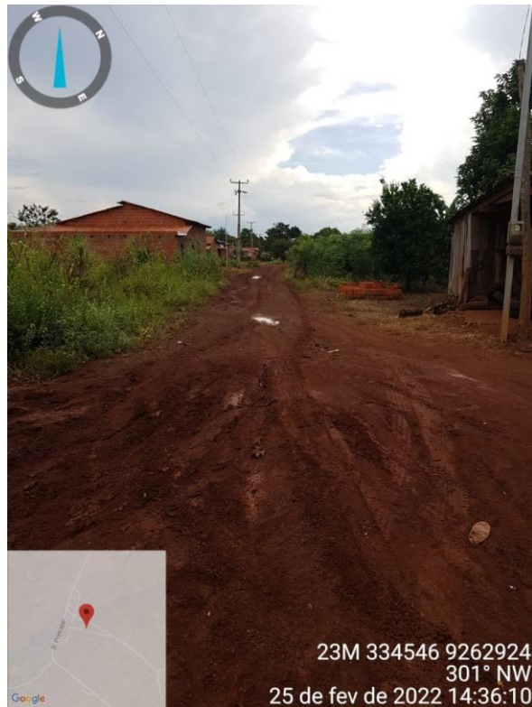
RUA DA CAIXA D'ÁGUA

OBRA: PAVIMENTAÇÃO EM BLOCO INTERTRAVADO NO MUNICÍPIO DE SÍTIO NOVO - MA LOCAL: POVOADO BOM LEMBRANÇA